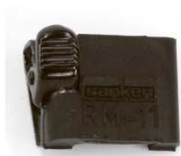
RM-11C-BK Резиновый крепёж с зажимом