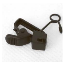
HC-11-** Зажим типа «прищепка» вертикальное крепление