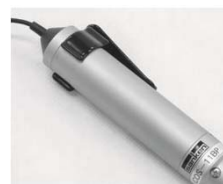
BELT CLIP для COS-11B Клипса для крепления на пояс COS-11BP