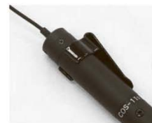
BELT CLIP для COS-11 Клипса для крепления на пояс COS-11