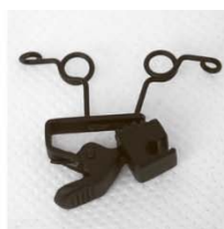
HC-11W-** Зажим типа «крокодил»