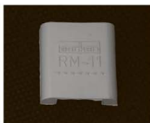
RM-11 Резиновый крепеж (беж.)