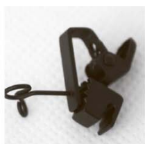
HC-11V-** Зажим типа «крокодил» двойной для двух COS-11