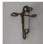
PIN-11 Английская булавка