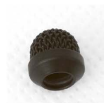
WS-11-** Металлическая ветрозащита