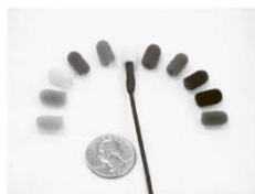
FW-11 Комплект ветрозащит (11 цветов в упаковке)