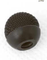
WSL-11 Большая металлическая ветрозащита только черного цвета